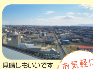
見晴しもいいです