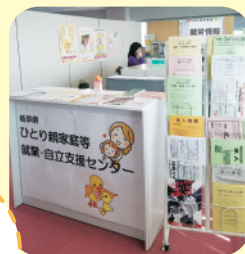
情報もいっぱいあります♪