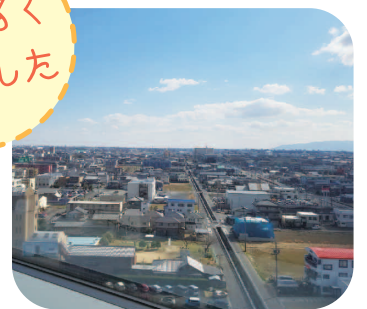
相談室から見える風景です