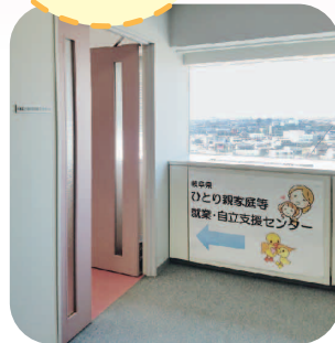
ポスターを目印にお越しください