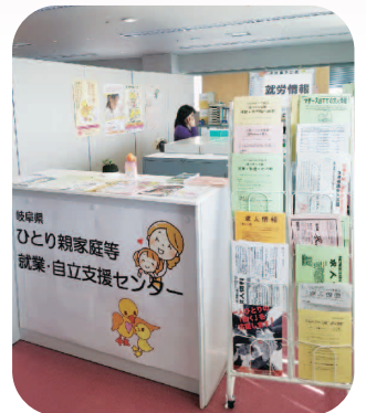
情報もいっぱいあります♪