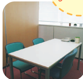
ご相談はこちらで